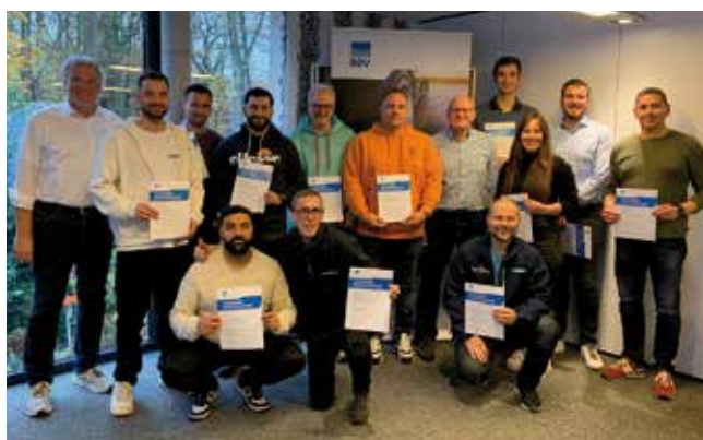
Abb. 4: Absolventen und Trainer des Moduls „Reifenmanagement & Zusatzverkäufe“ in der Weiterbildung zum Serviceberater Nutzfahrzeuge im November.