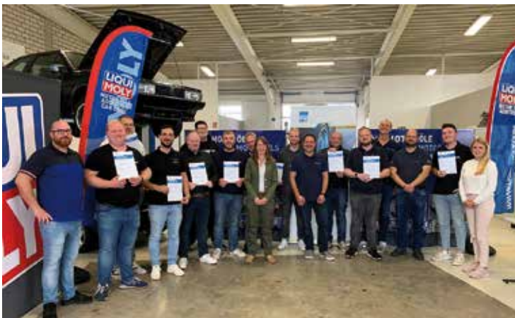
Abb. 1: Die zertifizierten Kfz-Serviceberater 2024 mit ihren Trainern und der Prüfungskommission.

Anfang September kamen im TAK-Labor in Köln-Wahn zehn Teilnehmer für die Weiterbildung zum Kfz-Serviceberater im Reifenfachhandel zusammen (Abb. 1). Der Lehrgang, der sich über acht Schulungstage und einen Prüfungstag erstreckte, wird von Liqui Moly gesponsort. Im ersten Teil des Lehrgangs