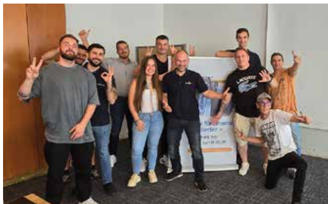
Abb. 3: Strahlende Gesichter bei den Teilnehmern an Modul 3a des Lehrgangs zum Serviceberater Nutzfahrzeugreifen nach erfolgreichem Abschluss des Moduls.